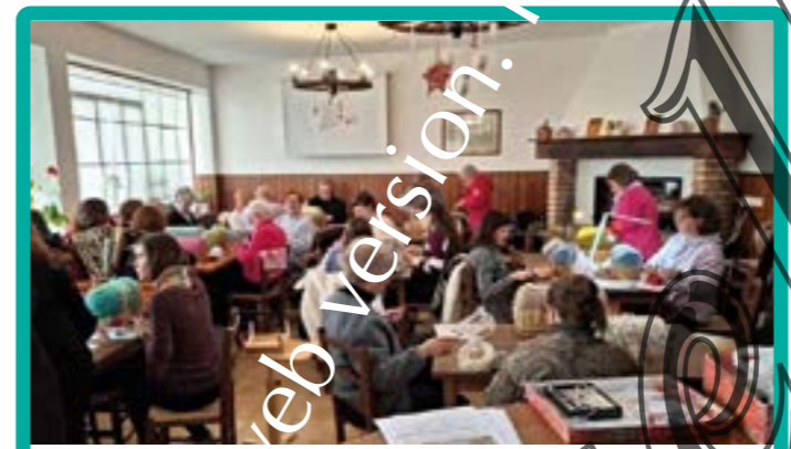
alle origini del merletto febbraio 2025