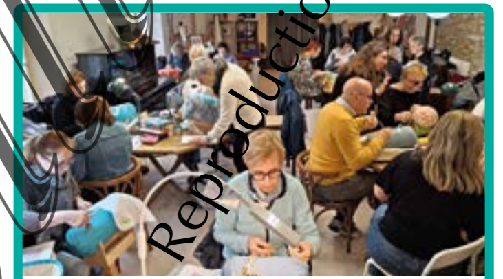
codice colori - valenciennes - honiton marzo 2025